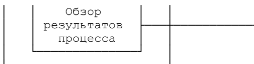
Рис. 1 Общая схема типового процесса управления исками для качества.

Могут применяться и другие модели. Значение каждого компонента этой структуры может быть разным в разных случаях, но надежный процесс должен учитывать все компоненты, детализированные до такой степени, которая соответствует отдельному риску для качества.